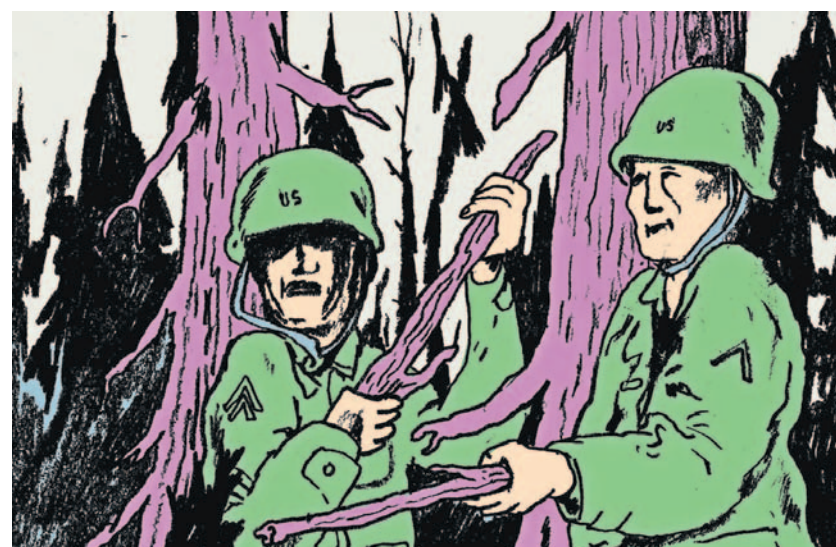
Illustration: Michael Jordan

Und welche Variante von den drei obengenannten ihm den Tod brachte – ist das letztendlich noch relevant? Heutzutage verschaffen einem weder der Heldentod auf dem Schlachtfeld noch der reuige Selbstmord Absolution. Das sind Erzählweisen früherer Generationen, die sich am Militärischen mehr begeistern konnten. Einmal immerhin hat der Werner richtig gehandelt. Bis dahin aber kämpfte er auf der Seite derjenigen, die den Endsieg verfolgten und die Endlösung betrieben. Von anderen Malen weiß die Katze.